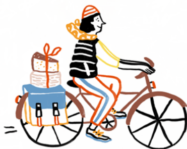
illustration : Marie ASSENAT

43 Grand Place t09 87 73 92 93 Crémier - fromager - produits du terroir et régionaux.