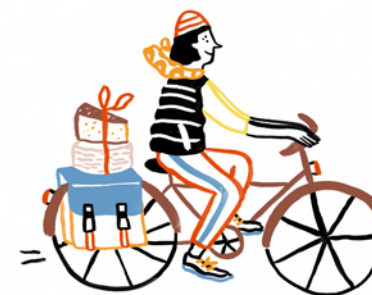
illustration : Marie ASSENAT

43 Grand Place t09 87 73 92 93 Crémier - fromager - produits du terroir et régionaux.