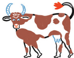
illustration : Marie ASSENAT

1926 route de Bailleul à Nieppe ☎03 20 48 60 63 - 06 81 33 99 33 laferme-dupontdachelles@orange.fr www.lafermedupontdachelles.fr Vente fruits et légumes locaux de saison, œufs, viandes, produits laitiers et fromages, produits sucrés, confitures, pâtisseries tartes, soupes, plantes aromatiques, bocaux. Vente sur place du lundi au jeudi de 9h à 12h30 et de 13h30 à 19h, vendredi et samedi de 9h à 19h.