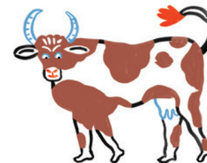
illustration : Marie ASSENAT

1926 route de Bailleul à Nieppe ☎03 20 48 60 63 - 06 81 33 99 33 laferme-dupontdachelles@orange.fr www.lafermedupontdachelles.fr Vente fruits et légumes locaux de saison, œufs, viandes, produits laitiers et fromages, produits sucrés, confitures, pâtisseries tartes, soupes, plantes aromatiques, bocaux. Vente sur place du lundi au jeudi de 9h à 12h30 et de 13h30 à 19h, vendredi et samedi de 9h à 19h.