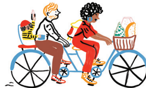
illustration : Marie ASSENAT

https://www.sintbernardus.be/fr/inthepicture-fr https://www.watou.com/onze-ambassadeurs/watoukaas.html Houblon et Fromage-Belgique.