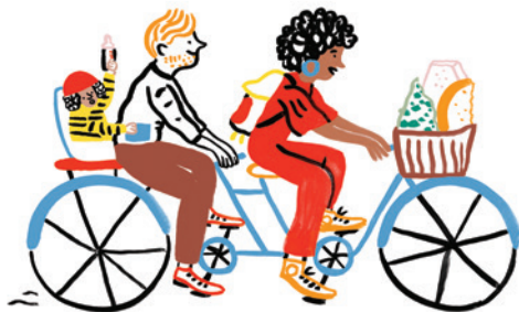
illustration : Marie ASSENAT

https://www.sintbernardus.be/fr/inthepicture-fr https://www.watou.com/onze-ambassadeurs/watoukaas.html Houblon et Fromage-Belgique.