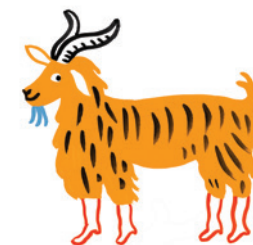
illustration : Marie ASSENAT