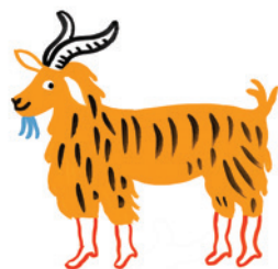
illustration : Marie ASSENAT