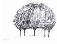
La Fleur Echappée Ravensberg - Belle

Twee andere structuren in Cœur de Flandre Twee andere gezinstochten: te voet (5,4 km) of met de fiets (21 km). Download ze via www.coeurdeflandre.fr