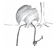
L'Observatoire caché Katsberg