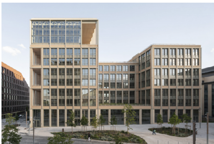
DREAM Village des athlètes – JO de Paris 2024