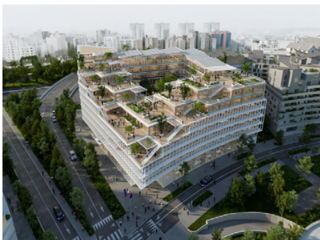
DREAM Pôle rectorat de l'académie de Créteil