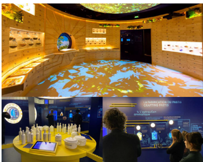
EPATANT Musée expérientiel Mx Experience, Pernod Ricard France