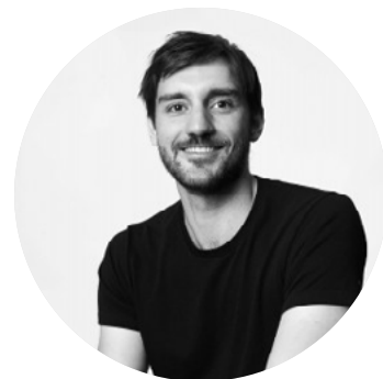
Agence DREAM Dimitri Roussel

L'agence DREAM (Dimitri Roussel Ensemble Architecture Metropole) a été créée en 2018 et compte aujourd'hui près de 40 collaborateurs. DREAM met au cœur de ses projets le commun en imaginant une architecture au service du vivre ensemble . Spécialiste des sujets urbains, DREAM tente de répondre aux problématiques de ses projets en favorisant le bien-être et la rencontre des utilisateurs. L'agence met l'écologie au cœur de ses projets en privilégiant des conceptions bioclimatiques et bas carbone.