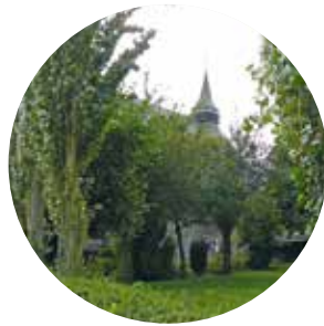
Départ de la mairie d'Oxelaëre.